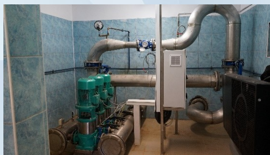
Pompy zaopatrujące w wodę gminny wodociąg

MZGK, który jest administratorem wodociągów, jak również w swojej strukturze ma stację uzdatniania wody w Śliwniku, posiada oprogramowanie monitorujące, dzięki któremu jest w stanie na bieżąco kontrolować jakość wody i jej zużycie. Przede wszystkim zaś wychwycić na jakim odcinku doszło do ewentualnej awarii i szybko ją usunąć.