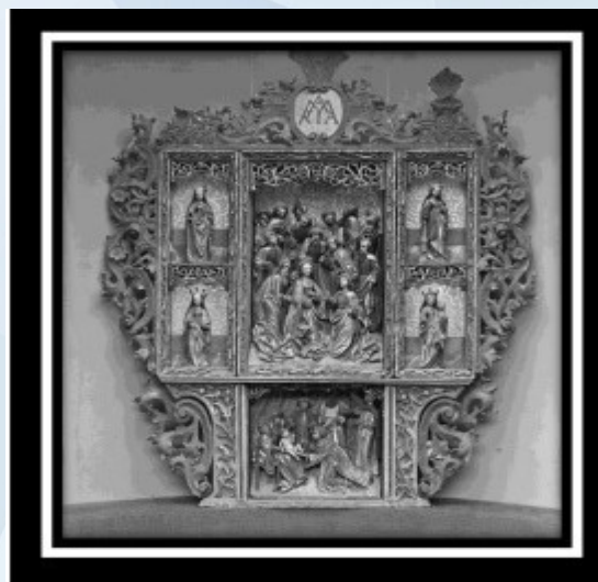
Widok z 1926 r.