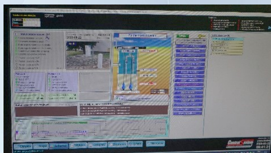
Centralny system monitorowania awarii wody w MZGK Małomice

Codziennie w celach konsumpcyjnych, jak i podczas wykonywania wielu czynności dnia codziennego, korzystacie Państwo z dobrej, czystej wody z wodociągu miejskiego w Małomicach. Jest ona najwyższej jakości i żeby taką być mogła musi być poddawana procesowi uzdatniania oraz oczyszczania.