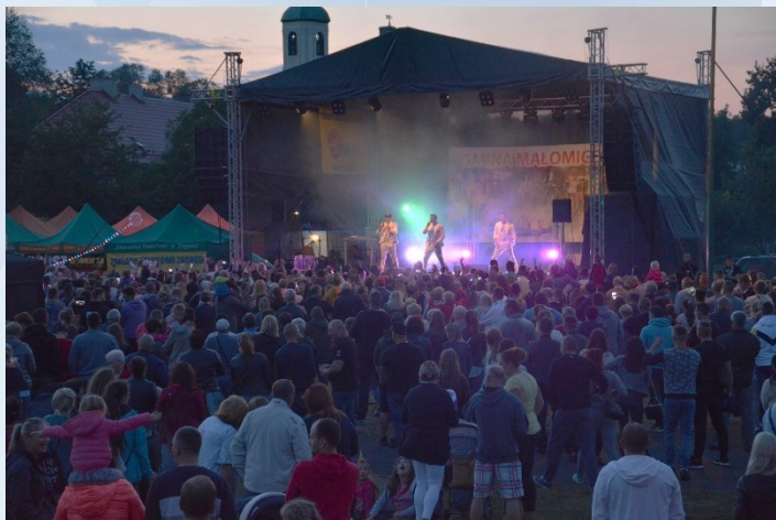
A tak się bawiliśmy przed rokiem )

Szanowni Mieszkańcy Gminy Małomice, w okresie, w którym obecnie się znaleźliśmy, a jest nim pandemia i zagrożenie koronawirusem, ogromną nieodpowiedzialnością byłoby organizowanie tak dużego wydarzenia, jakim są „Dni Małomic”. W naszej pamięci pozostają koncerty z minionych lat i wszyscy doskonale zdajemy sobie sprawę, że nie jest możliwe zapewnienie bezpieczeństwa wszystkim ich uczestnikom.