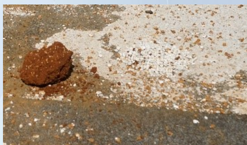
Żwir czyszczący wodę - biały przed wykorzystaniem i rdzawy po oczyszczeniu wody

Wszystko zaś po to, aby nie doszło do takiej sytuacji, że obudzą się Państwo któregoś dnia i chcąc zaparzyć kawę czy herbatę zabraknie wody w waszym kranie. Złoże ma bowiem swoją określoną objętość i może się wyczerpać. Pamiętajmy o tym szczególnie w czasie hydrologicznej suszy, która dotyka nie tylko Małomic, ale większość gmin w zachodniej i centralnej Polsce.